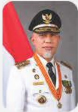
H. Mahyeldi Ansharullah, S.P. Gubernur Sumatera Barat