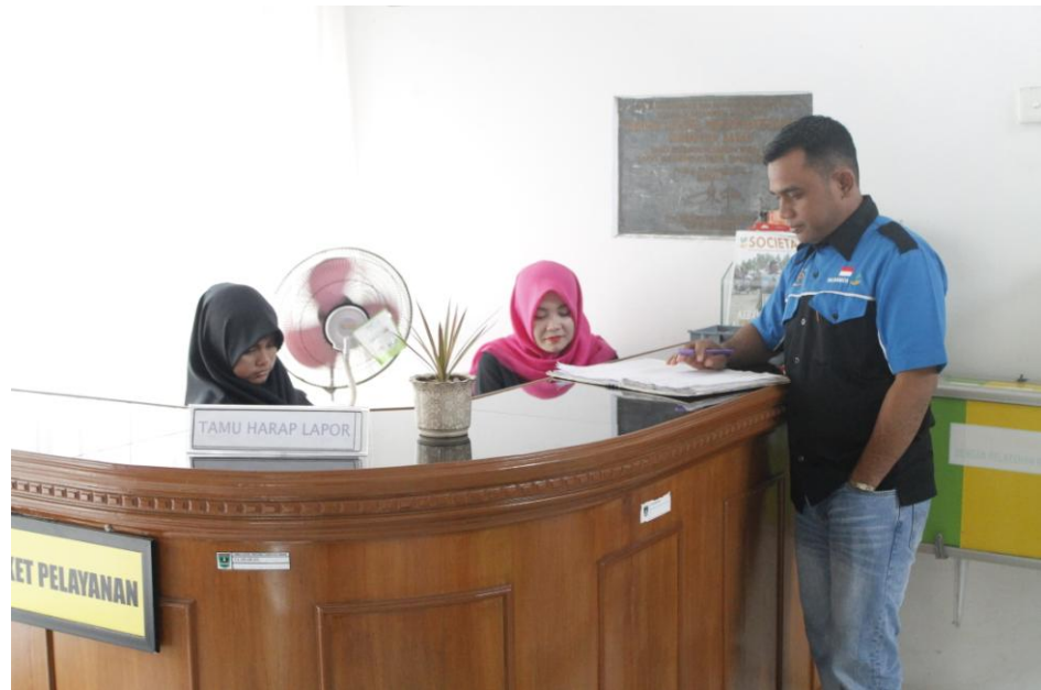
Photo petugas Costumer Service di Pelayanan Terdepan

b. Melengkapi Fasilitas Aksesibilitas bagi penyandang Disabilitas :